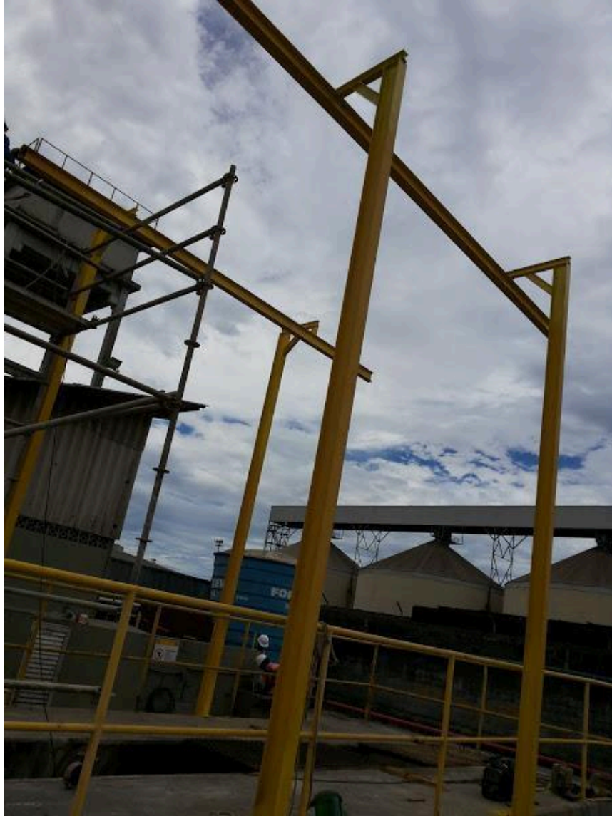
- Foto 16 (Obra: Fabricação e montagem de estruturas para linhas de vida).