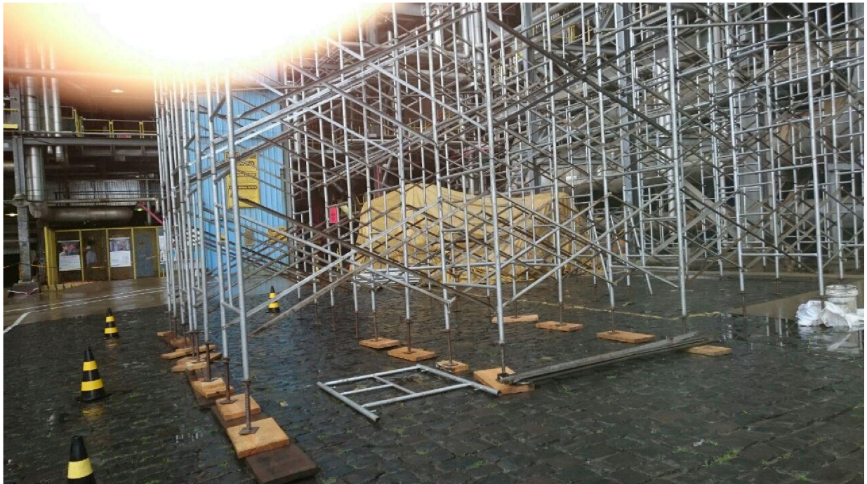
- Fotos 19 e 20 (Montagem de Andaime p/ escoramento - Parada Geral – West Rock (Rigesa)).