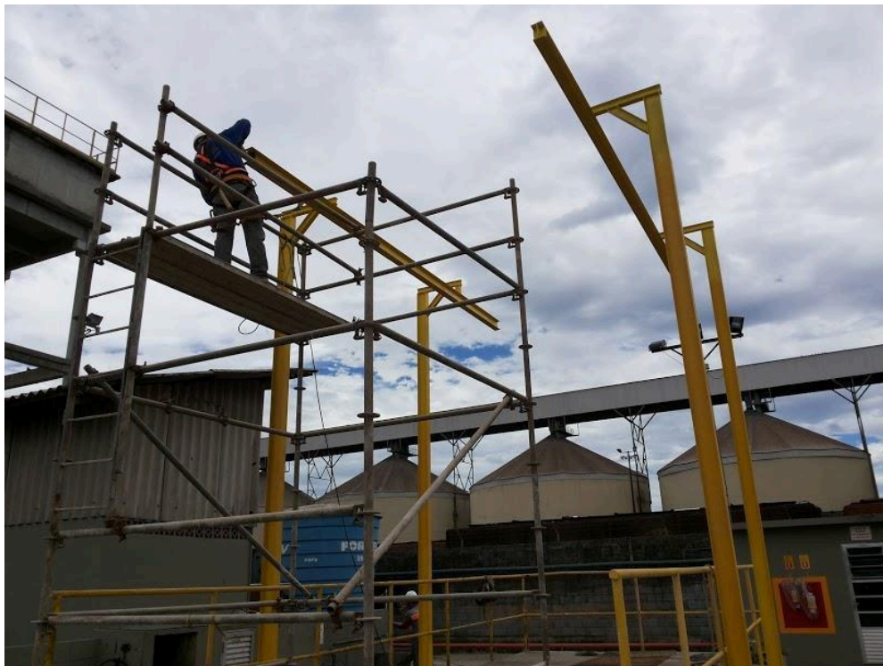
- Foto 15 (Obra: Fabricação e montagem de estruturas para linhas de vida).