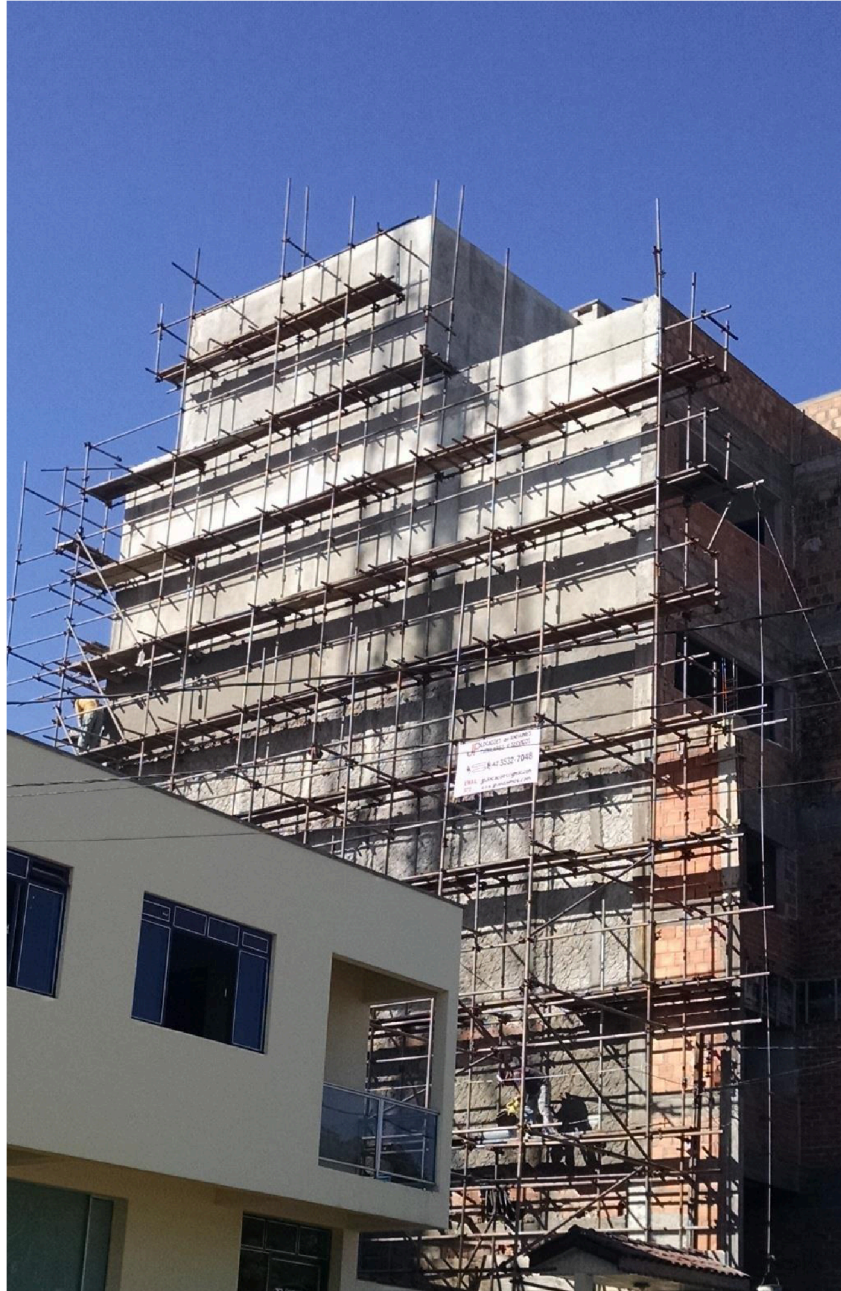
- Foto 08 (Obra: Montagem/Desmontagem de Andaime em construção civil).