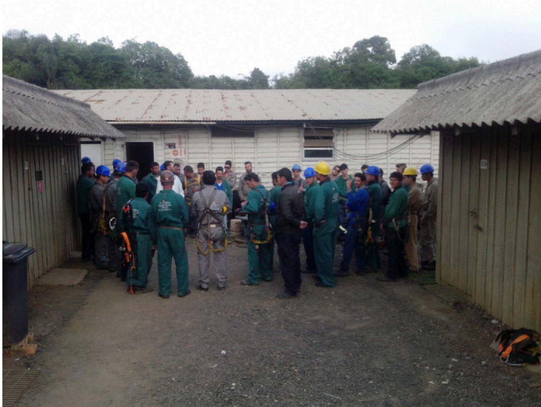
- Foto 07 (Reunião da equipe no DDS - Parada Geral West Rock (Rigesa)).