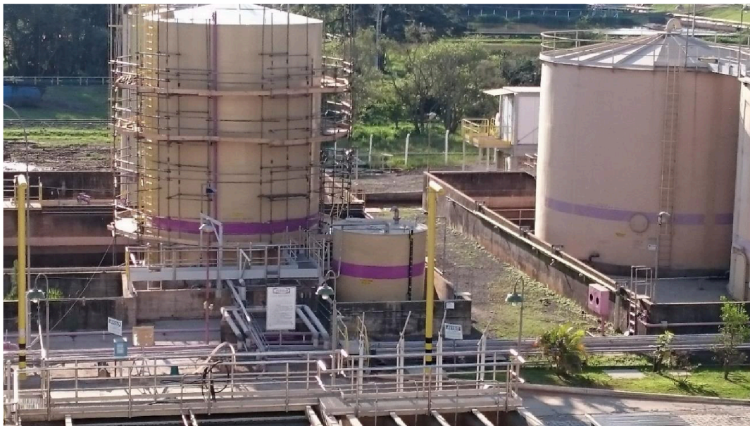
- Foto 06 (Obra: Pintura de Tanques, locação, montagem e desmontagem de andaimes – Rigesa).

Projetista; Supervisor; Encarregado; Montador de andaime; Ajudantes em geral; Caldeireiro Encanador Industrial Isolador Soldador; Mecânico Montador;