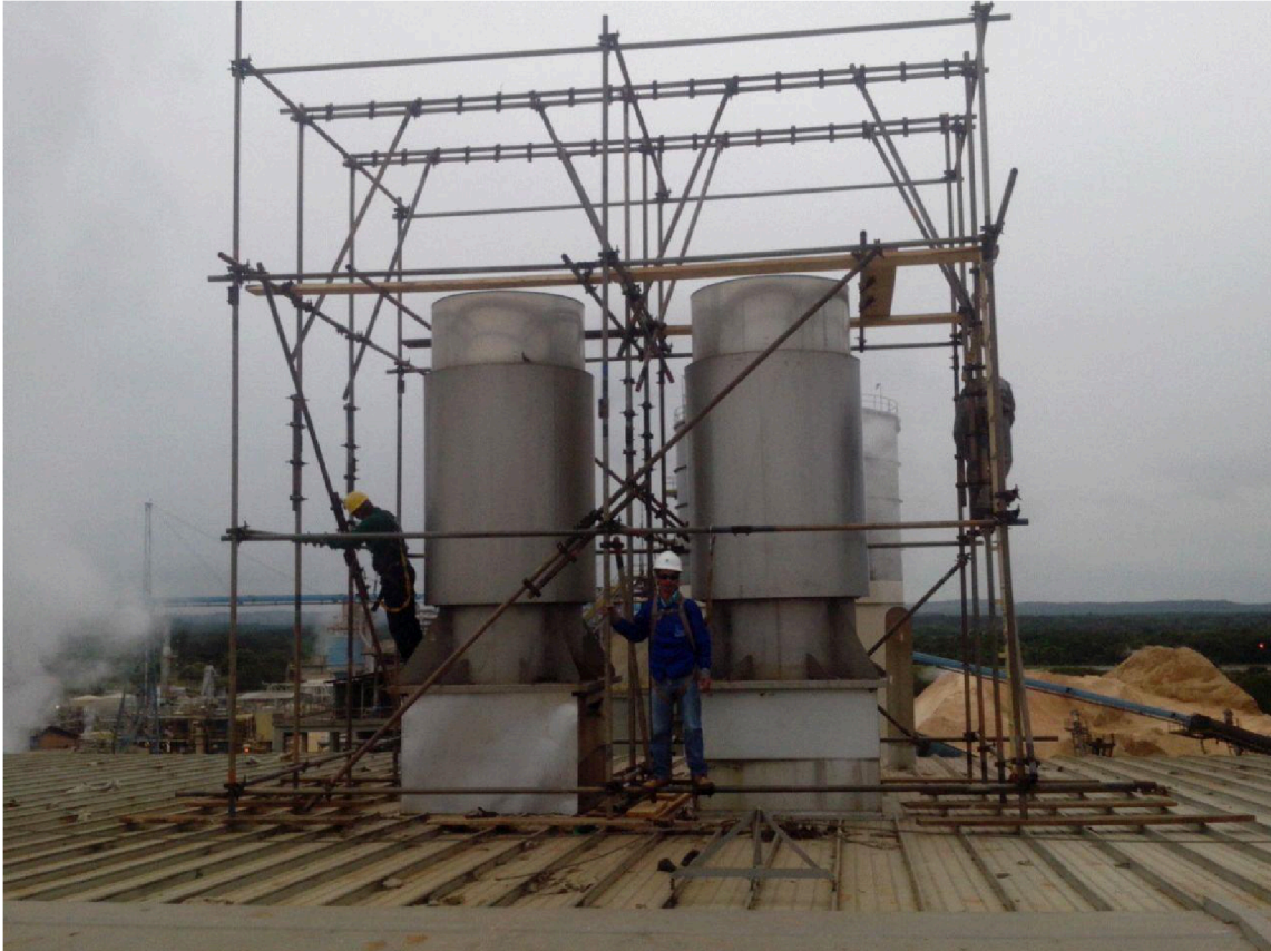
- Foto 21 (Montagem de Andaime c/ pau de carga, teto MP#4 - Parada Geral – West Rock (Rigesa))