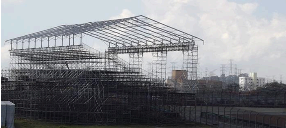
- Foto 02 (Obra: Montagem de Andaime - Projeto Formula 1 – Interlagos/SP).