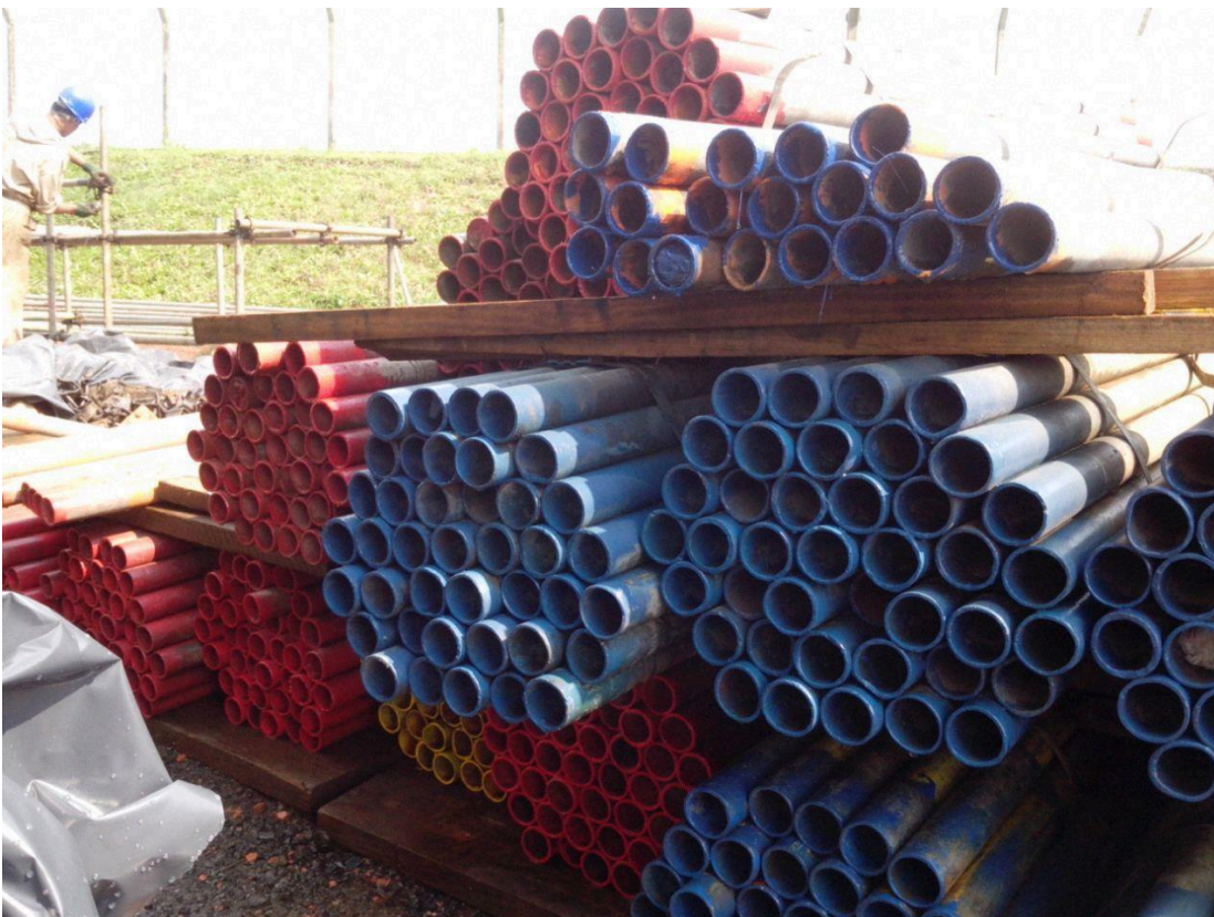
- Fotos 17 e 18 (Material de andaime utilizado na Parada Geral – West Rock (Rigesa)).