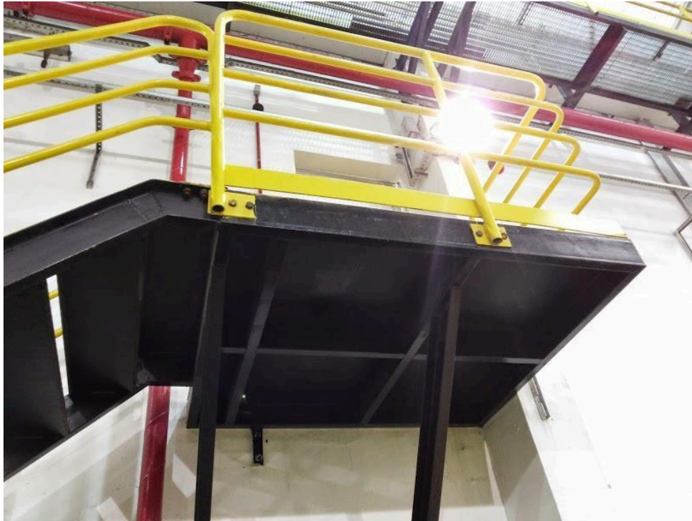
- Foto 14 (Obra: Fabricação e montagem de escadas, guarda corpo e corrimãos).