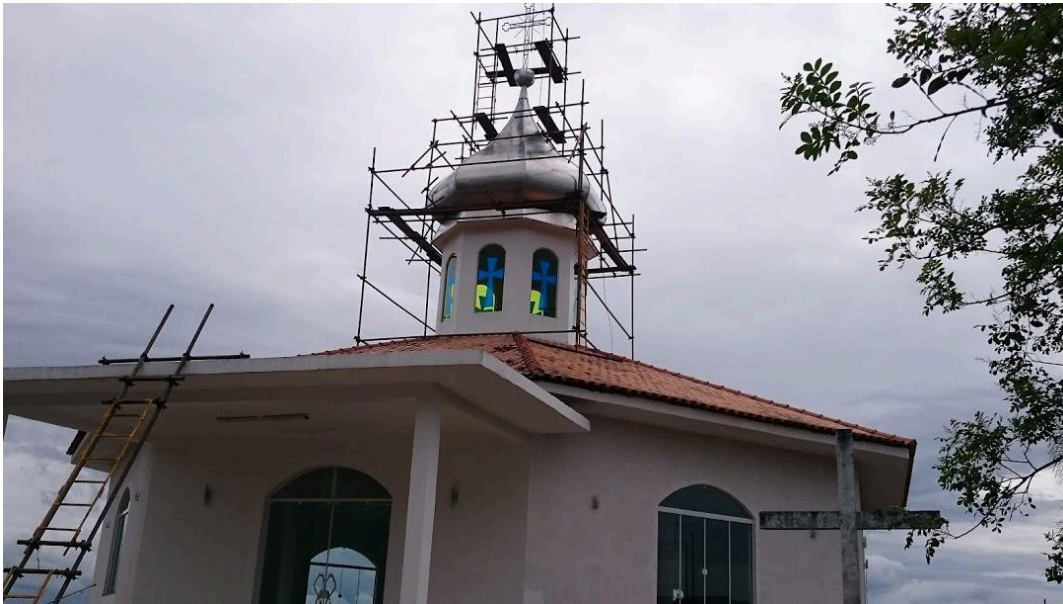
- Foto 11 (Obra: Montagem/Desmontagem de Andaime em construção civil).